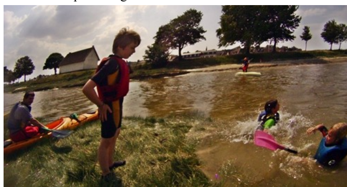
Barbotage à l'école de pagaie