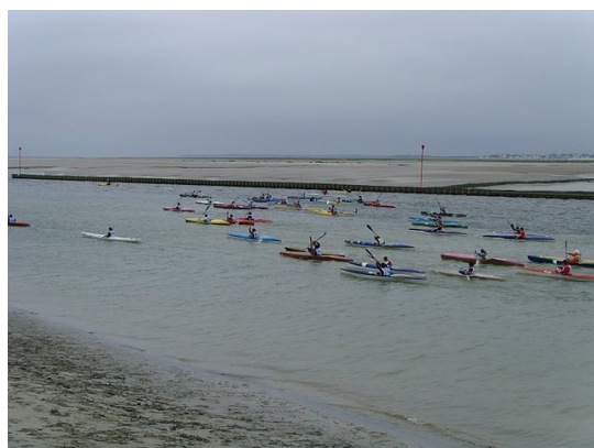
Départ de la finale jeunes